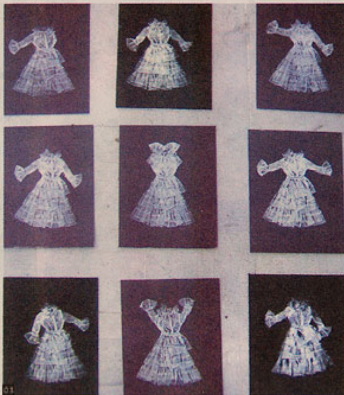
6. Άννα Ταουσάνη, Ζωγραφική εγκατάσταση, κάρβουνο σε χαρτί, διαστάσεις μεταβλητές