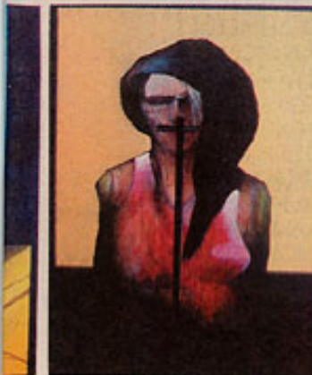
1. Μαρία Αρχιμανδρίτη, Χωρίς τίτλο, (2007, 80x115, λάδι σε καμβά)